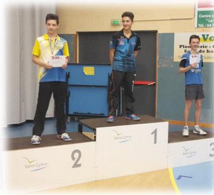
Robin sur la plus haute marche